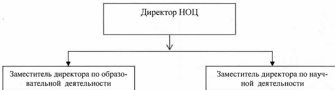
Рисунок 1. Структура НОЦ «Шнейдер Электрик – МГТУ им. Г.И. Носова»

4.8 Состав и штатное расписание дирекции НОЦ формируется за счет бюджетных и внебюджетных средств и утверждается ректором университета по представлению первого проректора – проректора по Н и ИР.