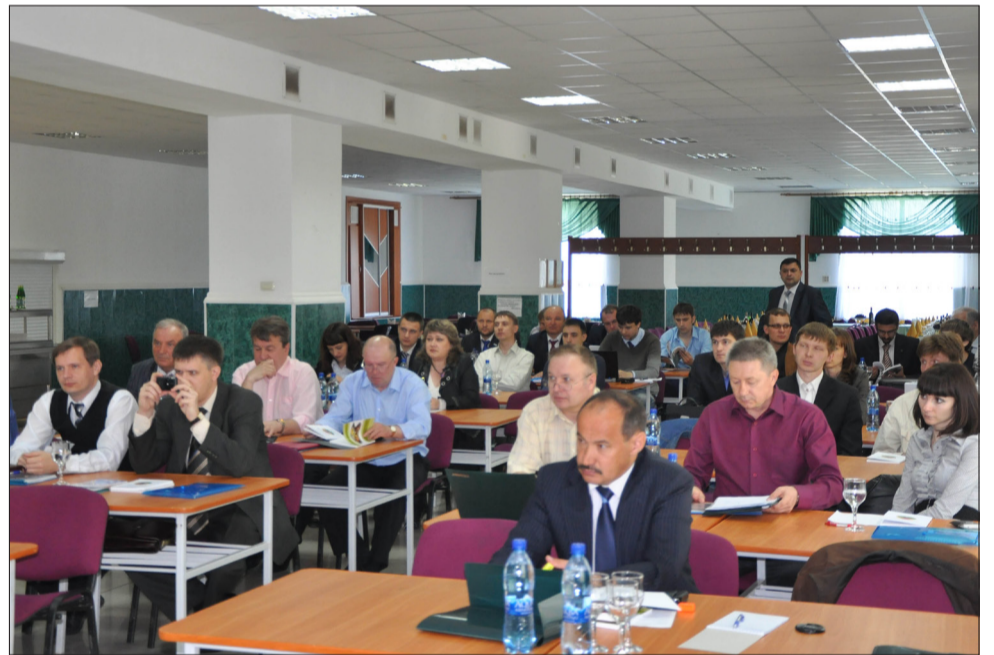
Международная конференция в УОЦ «Юность»