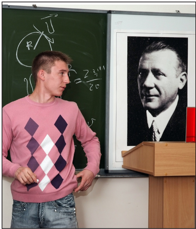
Физика и литература – рядом

25 мая преподаватели литературы и физики учебного комплекса «С» провели открытый интегрированный урок «Обзор романа М.А. Булгакова «Мастер и Маргарита»». Жизнеподobie и условность в романе». Идея столь необычного урока появилась не случайно. В услови-