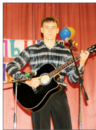
Выступление на «Музыкальном олимпе»

Следующая номинация – мужской вокал. Первое место заняла группа «School Street» (гр. МЛ-10, БЭ9-09), с песней «Sound School Street». Второе