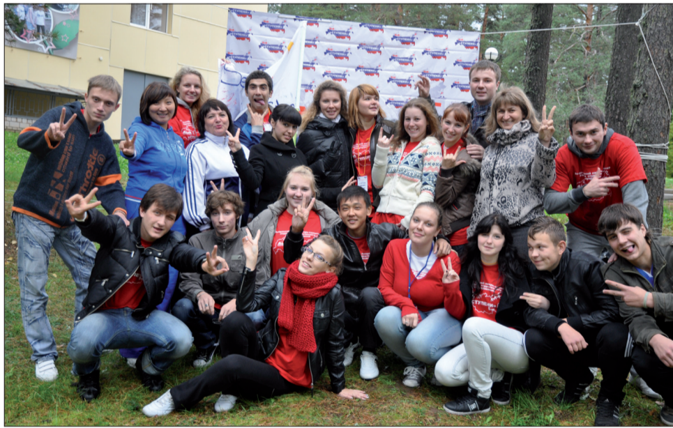
С новыми друзьями на семинаре лидеров студенческого самоуправления

С 3 по 7 октября в Ленинградской области состоялся Всероссийский лагерь-семинар лидеров студенческого самоуправления «Ступени», которому в этом году исполняется 5 лет.