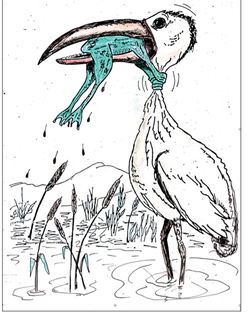
Автор Л.А. Скворцов