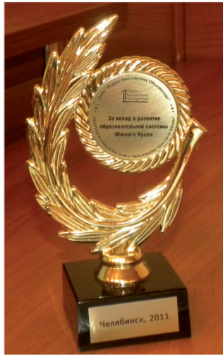
Памятный кубок Межрегиональной выставки

Серьезного развития требует такое направление деятельности, как мобильность студентов, поскольку она учитывается при министерских проверках. Тщательной работы требует и такая позиция, как тестирование оставшихся студентов. Что касается методической работы, то из аккредитационных