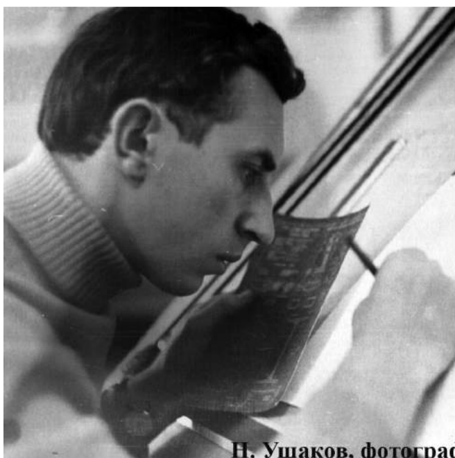
Н. Ушаков, фотограф