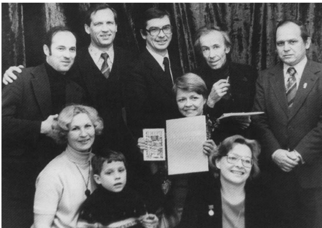
В гостях у МГМИ театр «Современник»