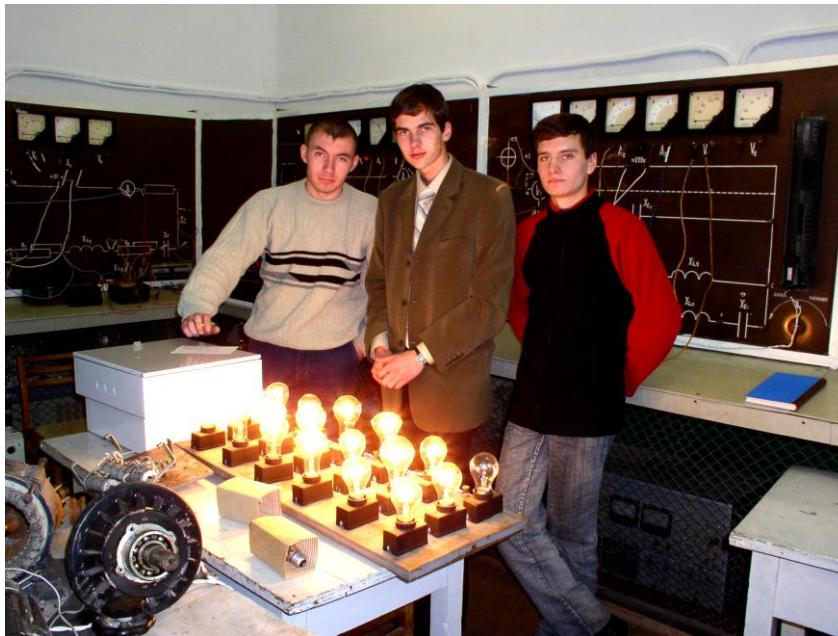
Фото 4. Занятия в лаборатории электротехники

- возможность постановки вопроса о целесообразности продолжения обучения студента еще до начала экзаменационной сессии или об освобождении от экзамена по итогам работы в семестре.