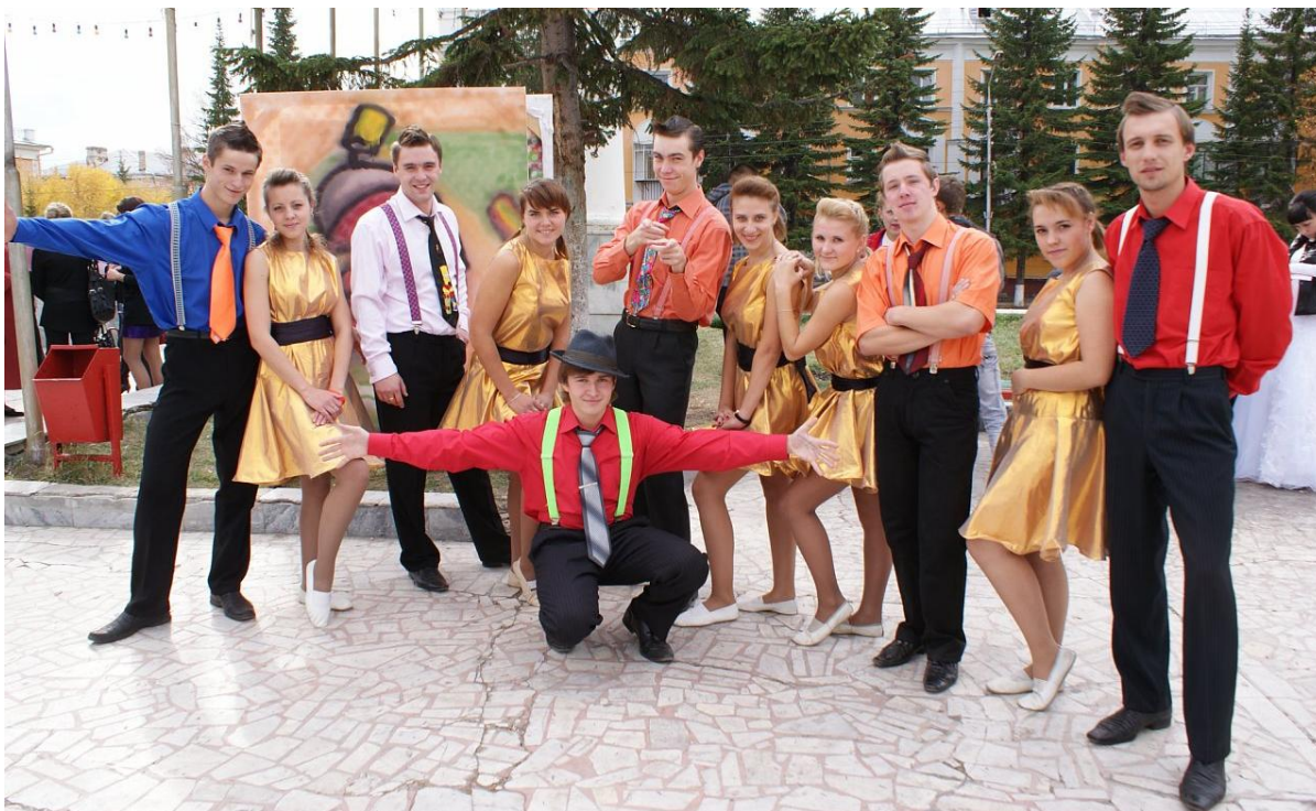
Фото 9. Студенческая весна – 2016

Среди культурно-массовых мероприятий, проводимых внутри филиала наибольшей популярностью среди студентов пользуются День Знаний, Посвящение в студенты, Новый год, Татьянин День, Последний звонок.