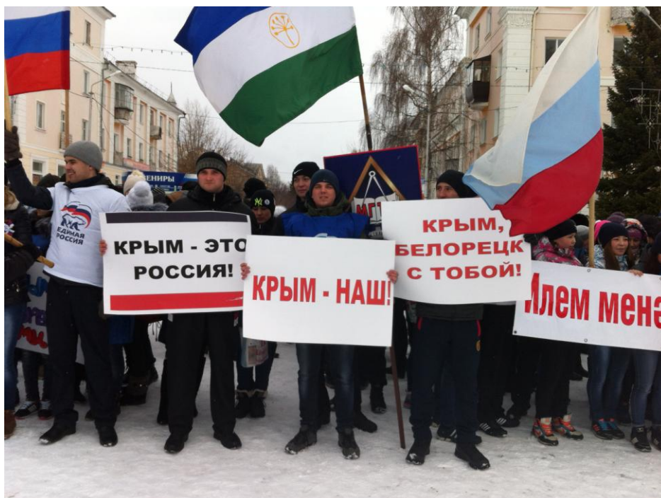
Фото 7. Студенты филиала на митинге, посвященном воссоединению Крыма с Россией

Внеучебная работа со студентами проводится по плану, который рассматривается и утверждается Ученым Советом филиала в начале нового учебного года. В конце учебного года заслушивается и утверждается отчет о выполнении плана воспитательной работы.