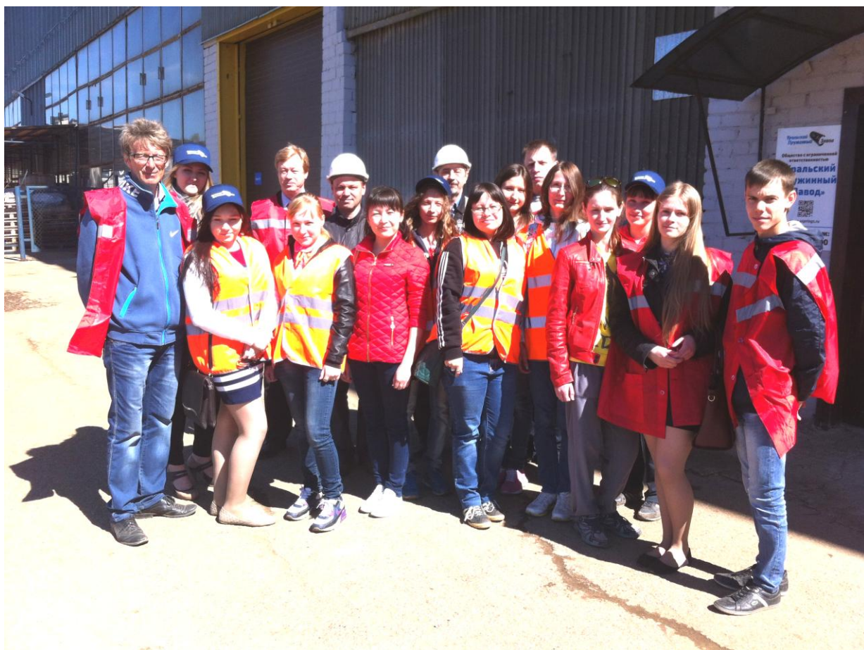
Фото 5. Студенты филиала на экскурсии на Уральском пружинном заводе