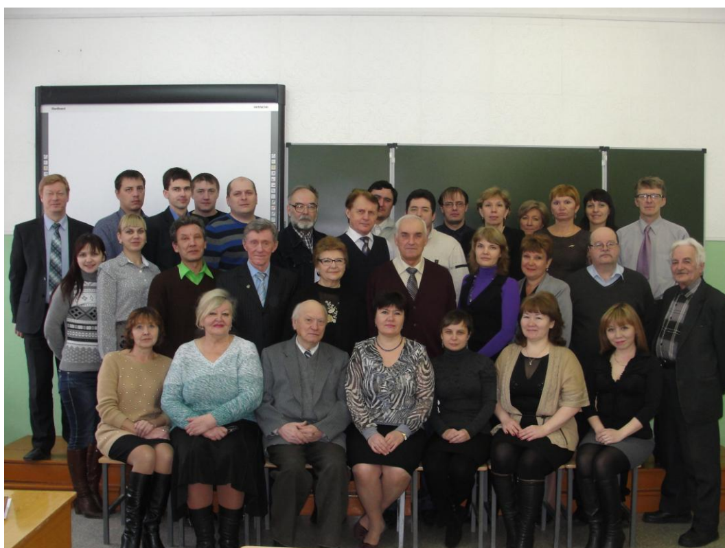
Фото 2. Коллектив преподавателей и сотрудников филиала