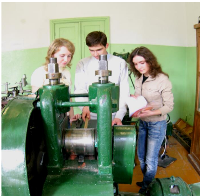
Фото 6. Студенты проводят экспериментальные исследования

Одним из перспективных направлений работы со студентами по выявлению талантливой молодежи является привлечение их к научной деятельности через конкурсы дипломных проектов, конкурсы грантов, участие в научно-технических конференциях и вовлечение в научные коллективы филиала и вуза. Ежегодно работы студенты филиала отмечаются дипломами и почетными грамотами на Всероссийском конкурсе выпускных квалификационных работ по направлению «Металлургия».