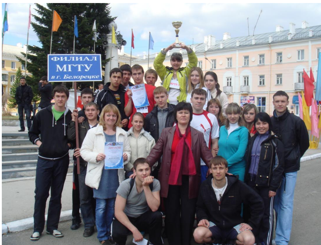
Фото 8. Победа в легкоатлетической эстафете

Для вновь поступивших студенты старших курсов организуют ознакомительное мероприятие: «Универ, знакомься – это мы!», в рамках которого первокурсники знакомятся с историей и традициями филиала, а также имеют возможность проявить свои способности и таланты.