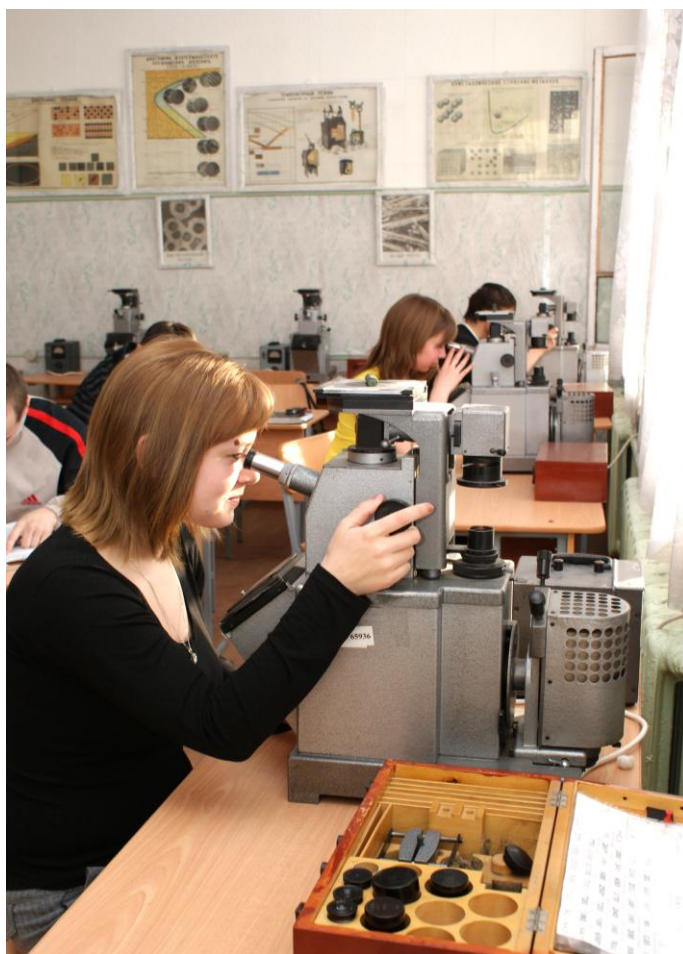
Фото 10. Студенты выполняют лабораторную работу

В здании филиала 38 учебных кабинетов, из них 3 поточные лекционных аудитории, 12 специализированных кабинетов, 14 учебных лабораторий, аудитории, оснащенные мультимедийным оборудованием. В филиале имеется интерактивное оборудование.