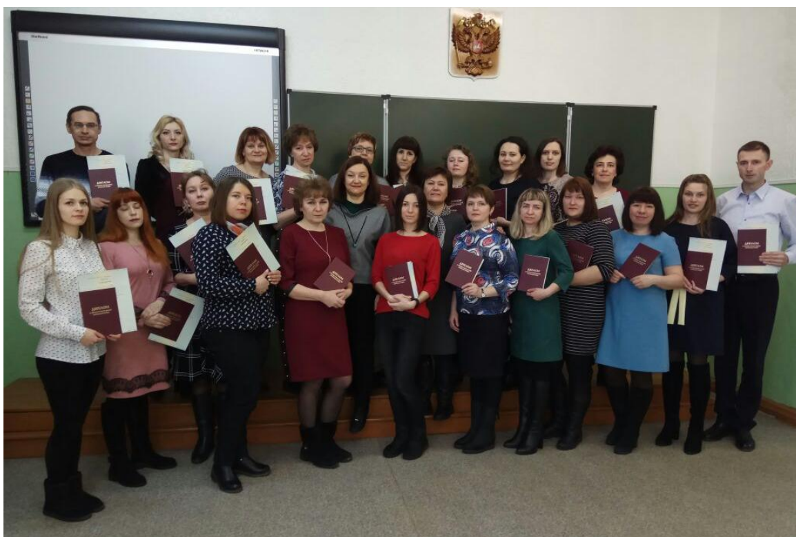
Фото 6. Выпуск группы профессиональной переподготовки по программе «Бухгалтерский учет, анализ и аудит»

- подготовительные курсы по общеобразовательным предметам для подготовки к ЕГЭ и поступлению в вуз.