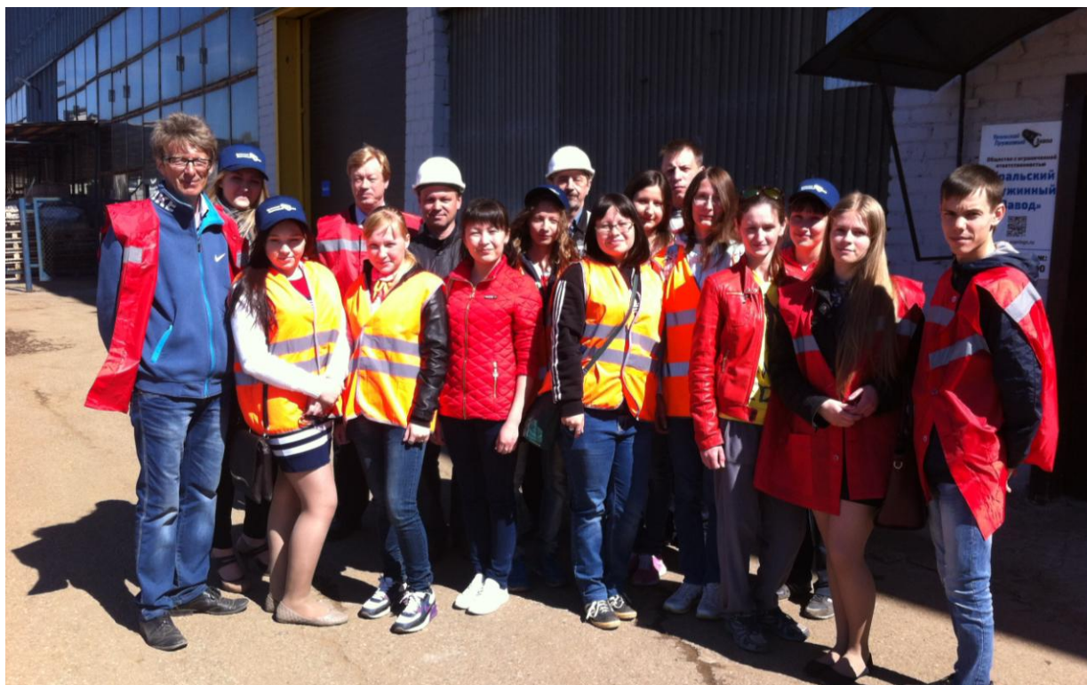
Фото 5. Студенты филиала на экскурсии на Уральском пружинном заводе

По результатам мониторинга эффективности вузов, проводимого Министерством образования и науки РФ, трудоустройство выпускников филиала составляет более 75 %.