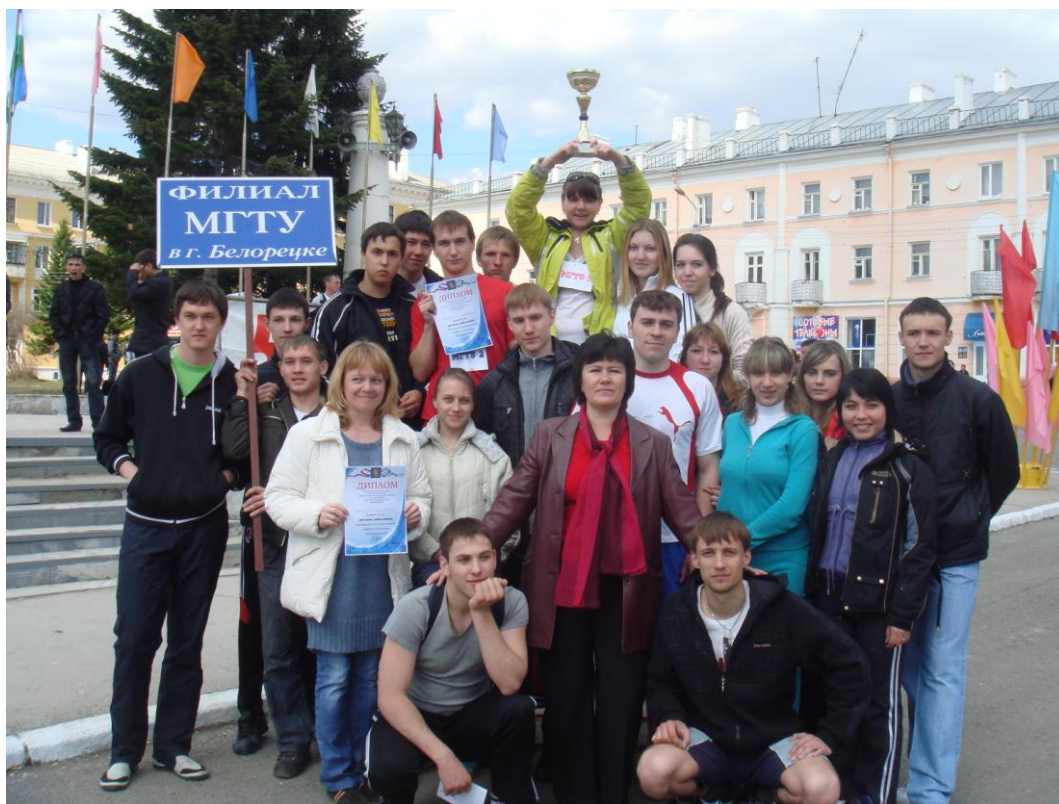
Фото 11. Победа в легкоатлетической эстафете

Для вновь поступивших студенты старших курсов организуют ознакомительное мероприятие: «Универ, знакомься – это мы!», в рамках которого первокурсники знакомятся с историей и традициями филиала, а также имеют возможность проявить свои способности и таланты.