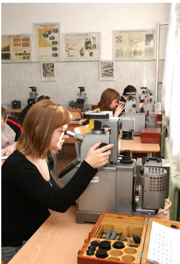
Фото 13. Студенты выполняют лабораторную работу

В здании филиала 38 учебных кабинетов, из них 3 поточные лекционных аудитории, 12 специализированных кабинетов, 14 учебных лабораторий, аудитории, оснащенные мультимедийным оборудованием. В филиале имеется интерактивное оборудование.