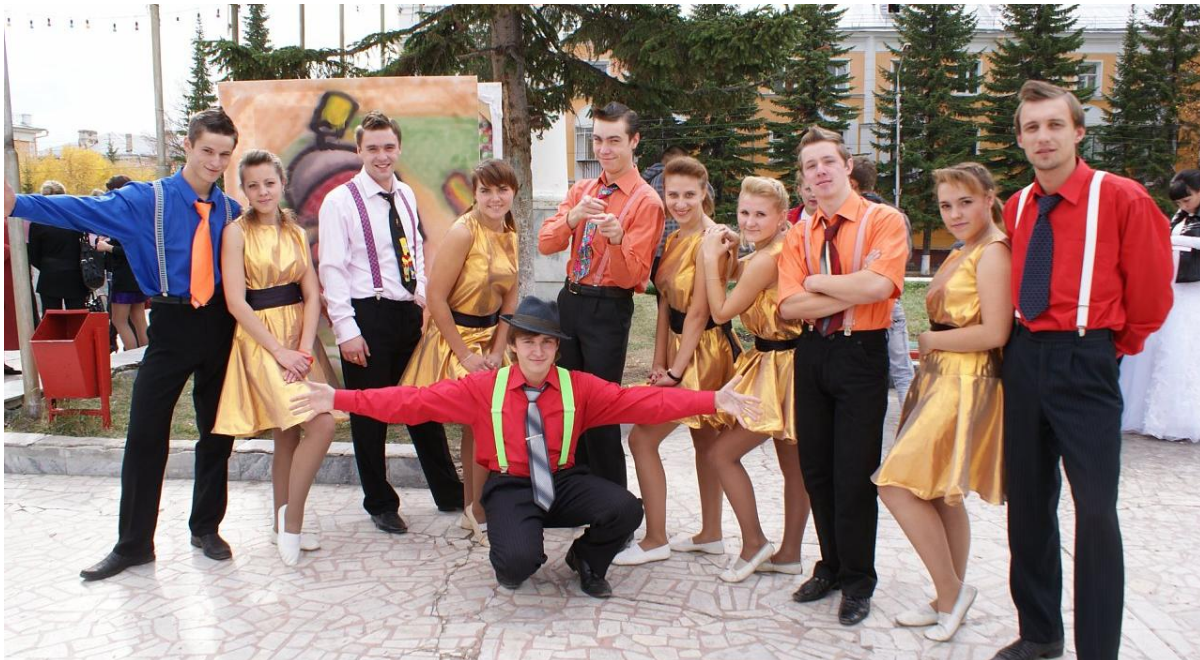
Фото 12. Фестиваль «Студенческая весна»

Среди культурно-массовых мероприятий, проводимых внутри филиала наибольшей популярностью среди студентов пользуются День Знаний, Посвящение в студенты, Новый год, Татьянин День, Последний звонок.