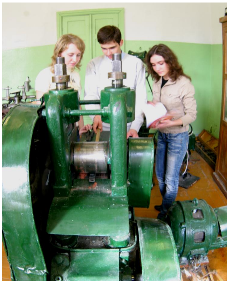
Фото 9. Студенты проводят экспериментальные исследования

С целью активизация научно-исследовательской деятельности в филиале необходимо: