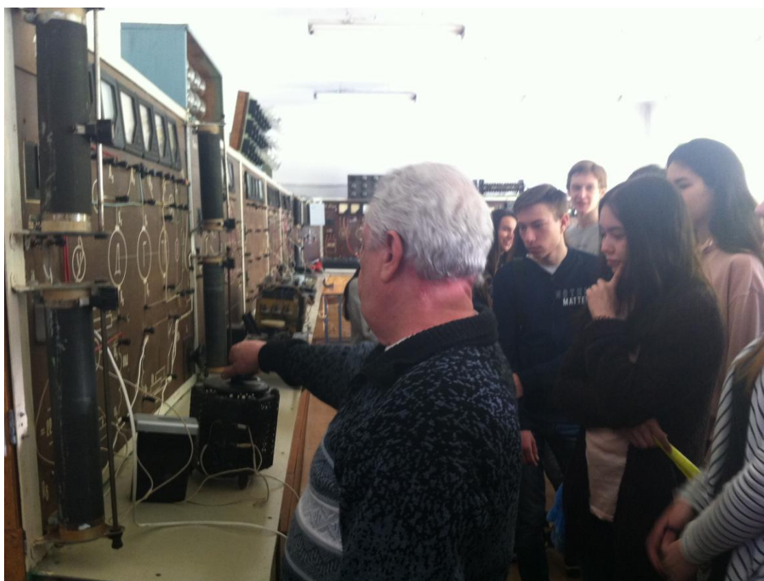
Фото 8. Обучающиеся 11 классов в лаборатории электротехники на экскурсии