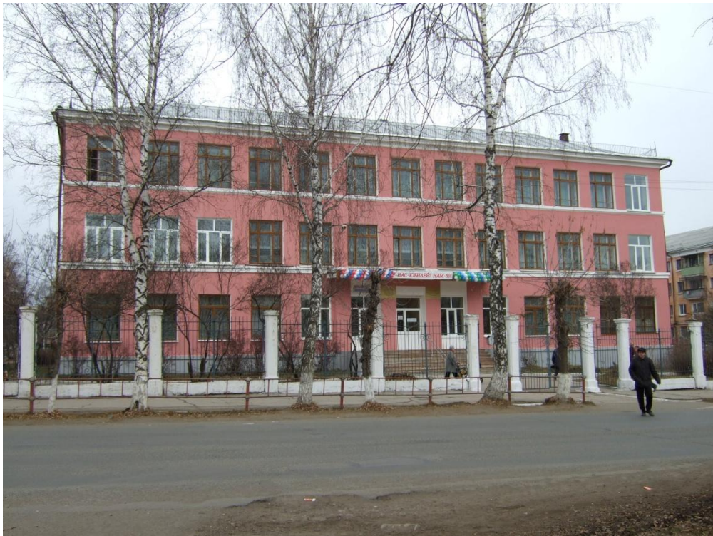
Здание филиала МГУ в г. Белоречке

Общее руководство филиалом осуществляет директор филиала, назначаемый ректором университета.