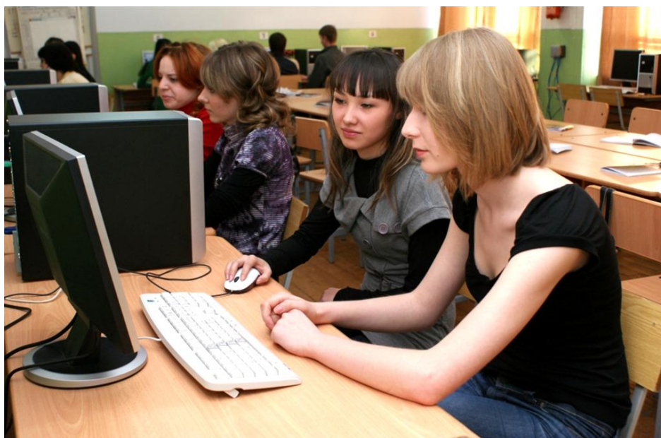
Занятия в кабинете информатики

Программы текущего и промежуточного контроля, итоговой аттестации и диагностические средства оценки знаний студентов соответствуют требованиям к выпускникам.