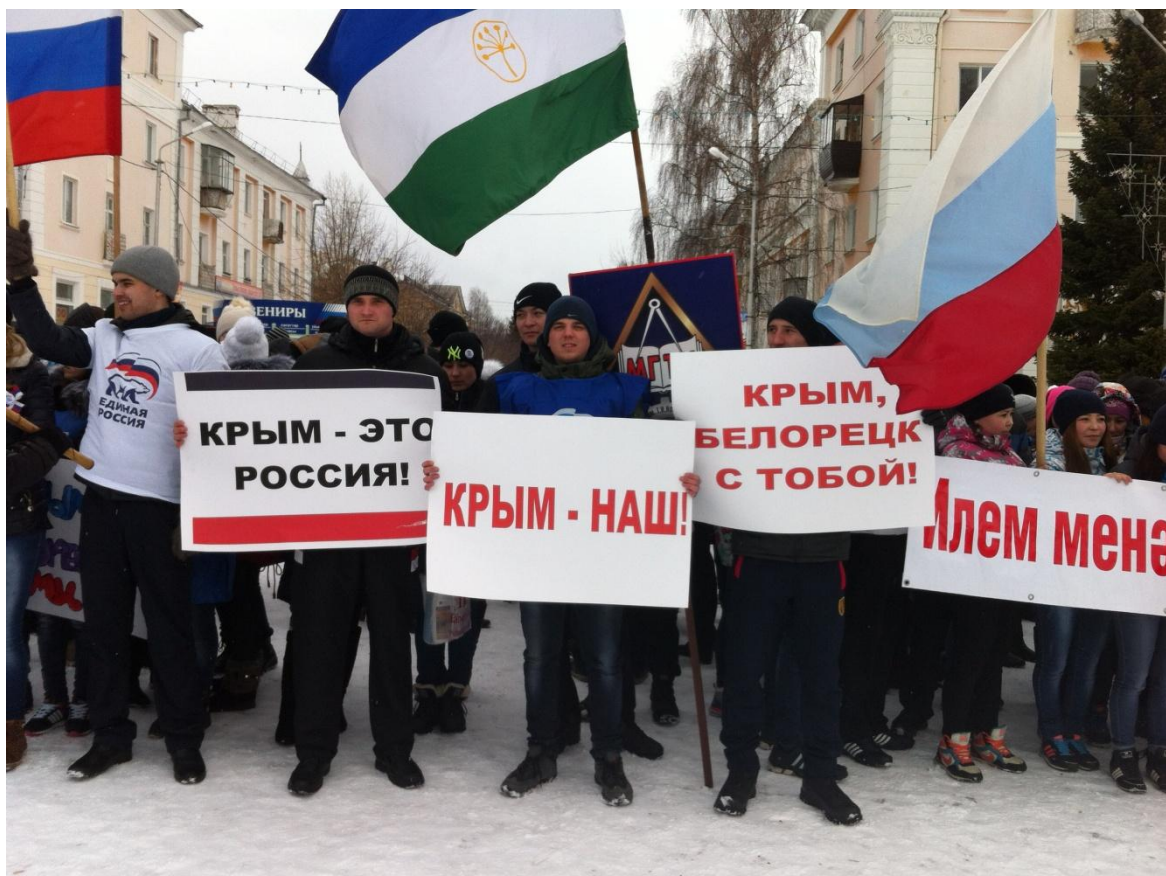
Студенты филиала на митинге, посвященному Пятой годовщине воссоединению Крыма с Россией

Внеучебная работа со студентами проводится по плану, который рассматривается и утверждается Ученым Советом филиала в начале нового учебного года. В конце учебного года заслушивается и утверждается отчет о выполнении плана воспитательной работы.