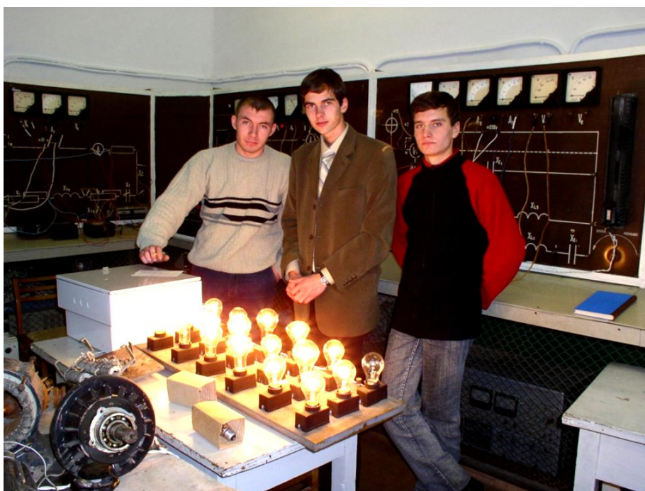
Занятия в лаборатории электротехники

- возможность постановки вопроса о целесообразности продолжения обучения студента еще до начала экзаменационной сессии или об освобождении от экзамена по итогам работы в семестре.