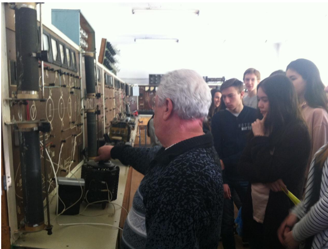
Обучающиеся 11 классов в лаборатории электротехники на экскурсии