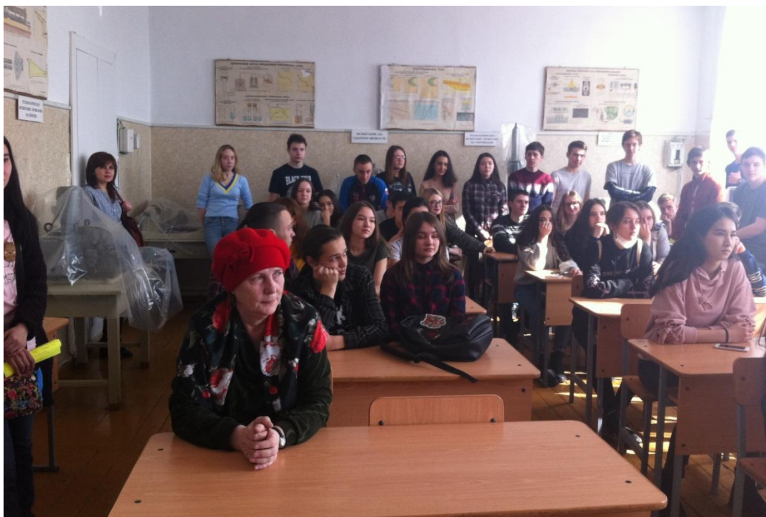
Учащиеся 11-х классов школ в лаборатории металловедения и термической обработки металлов на экскурсии