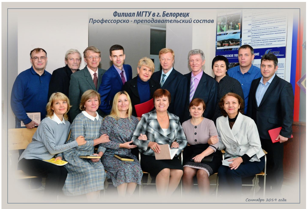
Коллектив преподавателей и сотрудников филиала

Общее руководство филиалом осуществляет директор филиала, назначаемый ректором университета.