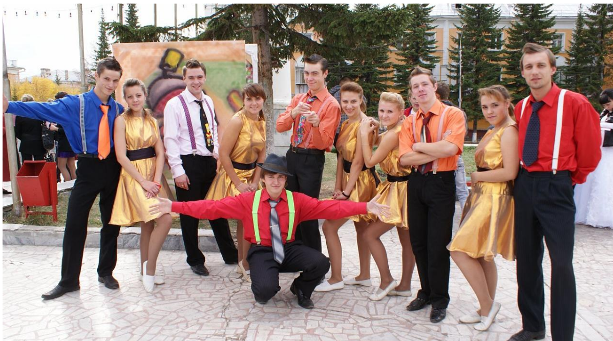
Фестиваль «Студенческая весна»

Среди культурно-массовых мероприятий, проводимых внутри филиала наибольшей популярностью среди студентов пользуются День Знаний, Посвящение в студенты, Новый год, Татьянин День, Последний звонок.