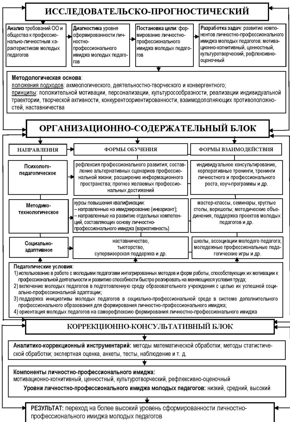
Рисунок 1– Модель формирования личностно-профессионального имиджа молодых педагогов в системе дополнительного профессионального образования